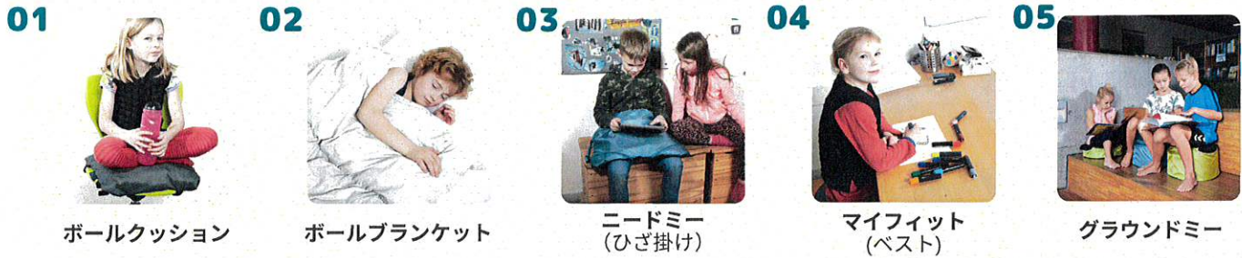
ボールクッション